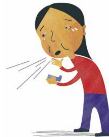
Barn med hoste, irriterte øyne og astma

Barn som puster inn tobakksrøyk, må oftere til legen enn andre barn