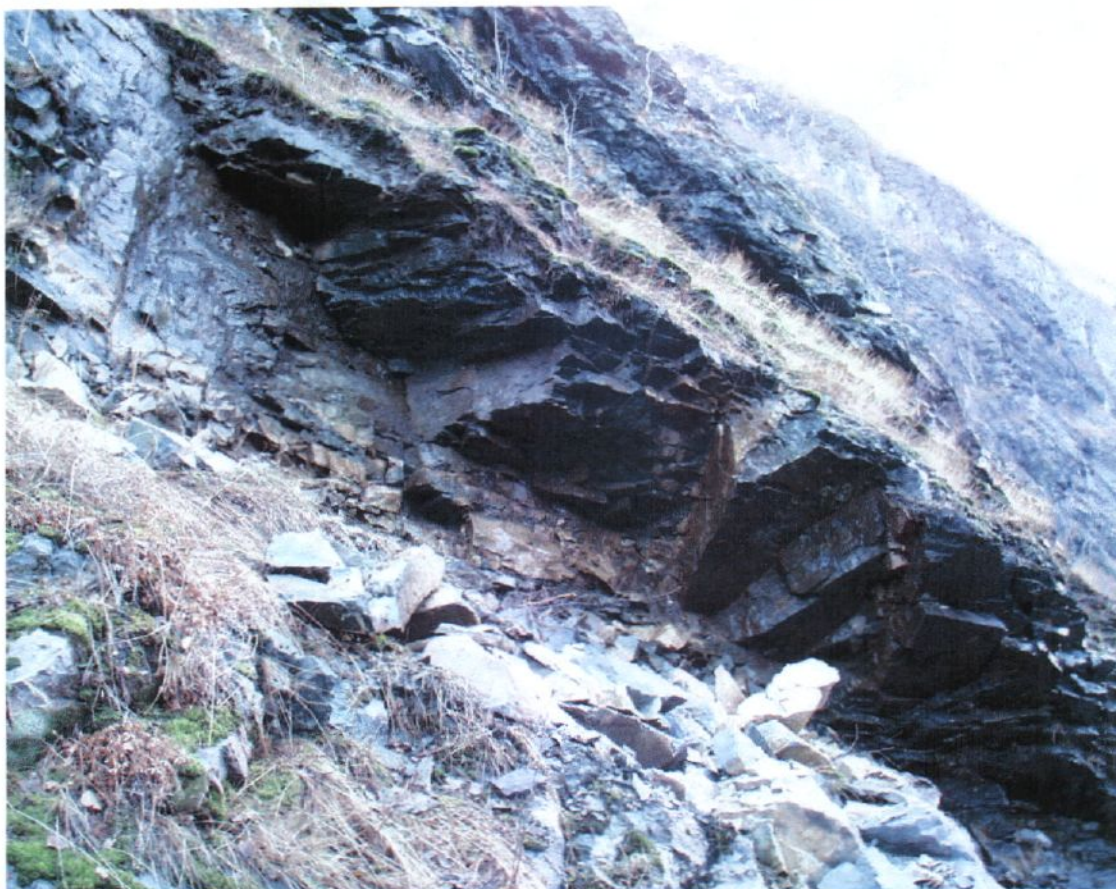
3: Fv. 303, Seimsdaltunnelen aust, sleppområde, 13-01-2005