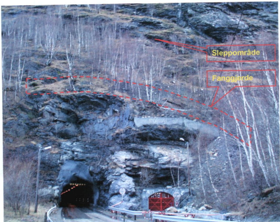
1: Fv. 303, Seimsdaltunnelen aust, km 2,510, 13-01-2005