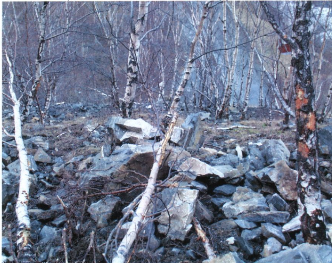
4: Fv. 303, Seimsdaltunnelen aust, steinmassar over tunnelopninga, 13-01-2005